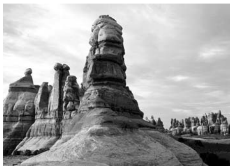
Chesler Park, The Needles

des besten Geländefahrers. Jenseits der Gräben führen Naturstrassen und Pfade zum Confluence Overlook, einem Aussichtspunkt, welcher 305m über dem Zusammenreffen des Green und Colorado Flusses liegt. Durch dieses Land streiften einst die Anasazi-Indianer (die Ureinwohner), ein Volk, das Ackerbau betrieb (Mais, Kürbis, Bohnen), Rehe und Dickhornschafe jagte, sowie Samen, Obst und Wurzeln sammelte. Die Anasazi gehörten zur selben entwickelten Kultur, welche die grossen Pueblos von Mesa Verde im Bundesstaat Colorado und Chaco Canyon im Bundesstaat New Mexico schufen. Spuren der Anasazi findet man in fast jedem Canyon des Needles-Distrikts. Viele ihrer Ruinen sind bemerkenswert gut erhalten. Tower Ruin ("Turmruine"), in einer hohen Felsnische gelegen, befindet sich in einem Nebencanyon des Horse Canyon ("Pferde-Canyon") und ist ein ausgezeichnetes Beispiel für die Anasazi-Architektur. Die Anasazi und die prähistorischen Jäger und Sammler, welche Jahrhunderte vor ihnen hier lebten, haben an Klippen und Wänden auch Felszeichnungen (Pictographs) und Felsritzungen (Petroglyphs) hinterlassen. Die Bedeutung der Figuren, Gesichter, Handabdrücke und anderer Abbildungen bleibt grösstenteils ein Geheimnis. Viele Ueberreste von Töpfen, Werkzeugen und Geräten, welche diese Indianer einst verwendeten, sind leider von "Souvenirjägern" entwendet worden. Bitte lassen Sie solche Artefakte dort, wo Sie sie gefunden haben.