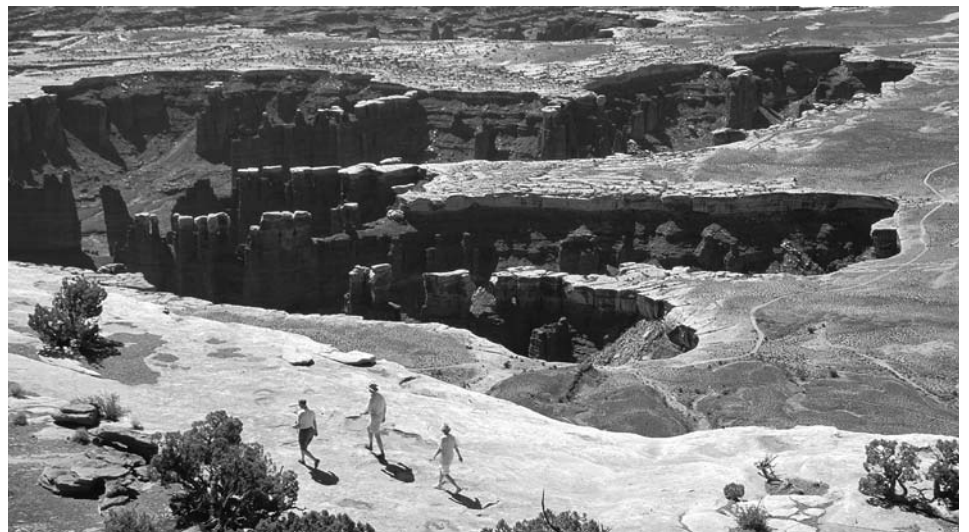
Grand View Point, Island in the Sky

Dickhornschafe, Kojoten und andere einheimische Tiere leben in diesem 848 km 2 grossen Nationalpark. Canyonlands—das bedeutet noch wildes Amerika.